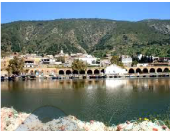
قشلة غار الملح