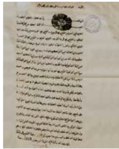
قرار الغاء العبوديّة