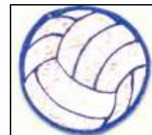
un robot bleu