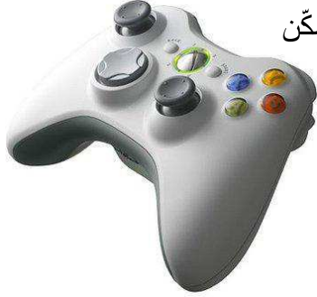
عصا التحكم اللاسلكية