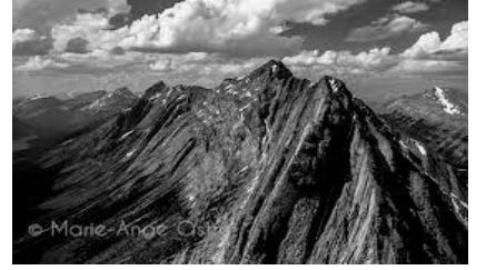
مشهد عدد 1

1_ يتميز المشهد الأول بشدة ارتفاعه مقارنة بالمشهدين 2 و 3 .