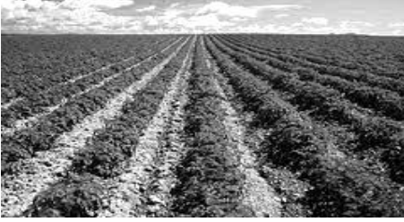
مشهد عدد 3

تبرز المشاهد التالية ثلاثة مظاهر طبيعية تتدخل الصخور في تكوينها: