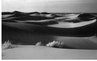
مشهد عدد 2