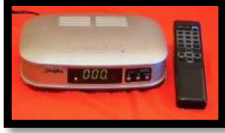
وحدة تحريك أوتوماتيكية