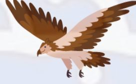
نسر يبحث عن فريسة