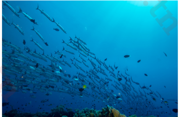
هجرة أسماك السلمون