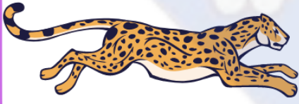
نمر يريد إمسك أرنب

الحيوانات أيضًا بحاجة ماسة إلى التنقل. يمكن أن يساعد التنقل الحيوانات على العثور على موارد الطعام والماء والشراكة في التكاثر. يتيح لهم الحركة الحرية في استكشاف المناطق المختلفة وتجنب المخاطر. يساهم التنقل في صحة وبقاء الحيوانات والحفاظ على توازن النظام البيئي.