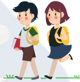
الذهاب إلى المدرسة