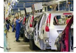
ورشة لصناعة السيارات