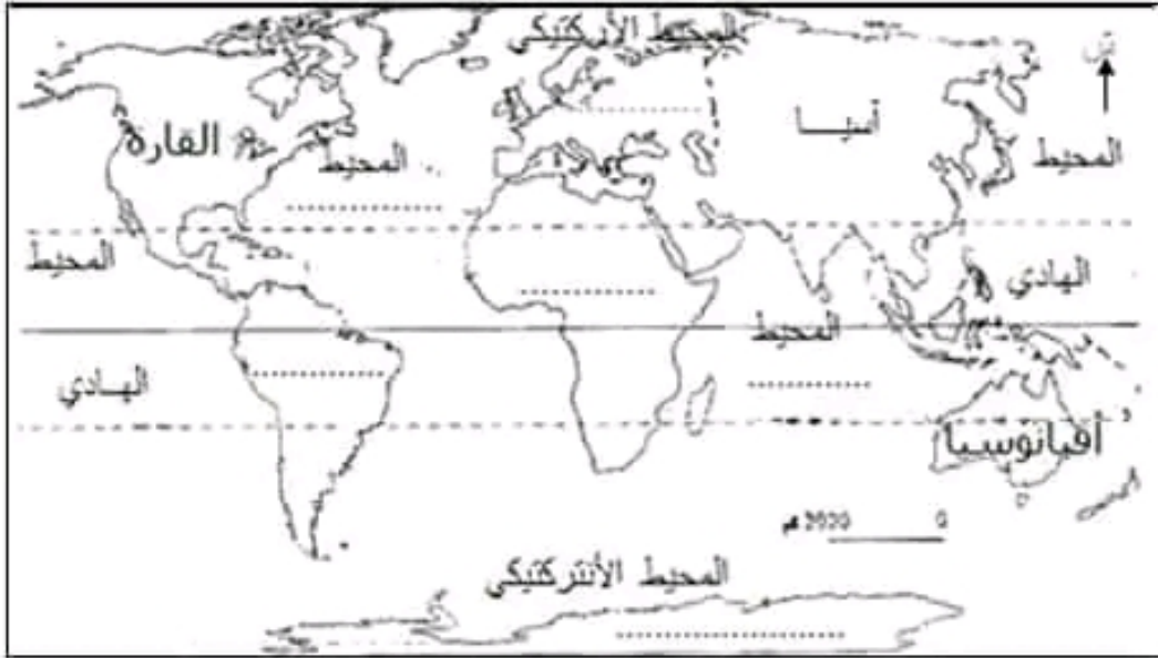
خريطة القارات والمحيطات