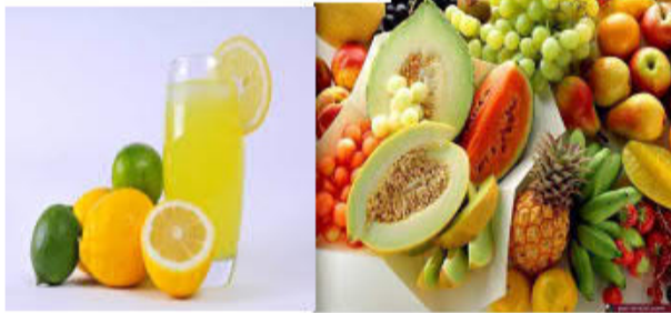
عصير - غلال