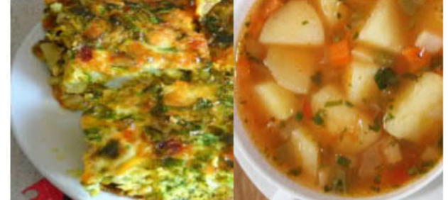
حساء - طاجين

الماء ضروري دائما نتناول منه كمية قليلة اثناء الاكل ثم وبعد الاكل بنصف ساعة نتناول ما يروي عطشنا لان تناول الماء مع الطعام قد يتعب عمل المعدة و يشعرا بالتخمة و الكسل.