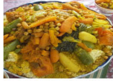
كسكسي باللحم او بالسّمك