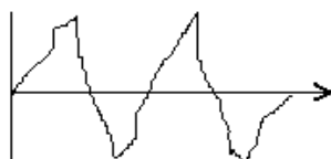
Le son .....

numérique - la fréquence - la capacité - analogique - échantillonnage - une vibration - l'ordinateur - le timbre