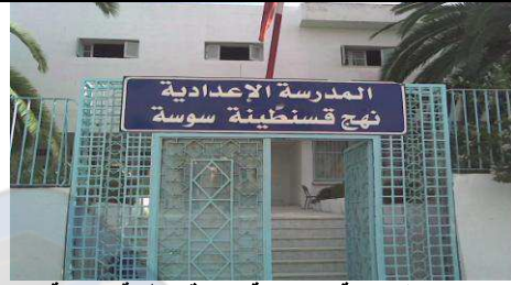
المدرسة الإعدادية نهج قسنطينة سوسة