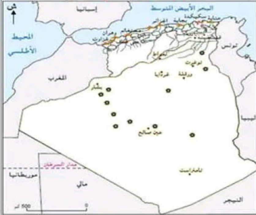
خريطة المجال الفلاحي الجزائري