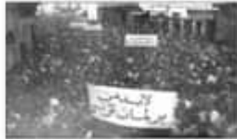
مظاهرة 9 أفريل 1938 بتونس العاصمة

وفي 8 أفريل 1938 قامت مظاهرات هائلة شملت كامل البلاد التونسيّة، اعتُقل إنترها أبرز زعمائها "علي بلهوان"